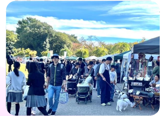
『 Re:Bornアニマルバトンフェスタ2024 』の様子 (来場者18,500人 ペット5,700頭)

産学官民における、たくさんの業界の皆さまにご参加いただきたく存じますので、当要項をご覧の上 ご出展、またはご協賛いただけますと幸いです。