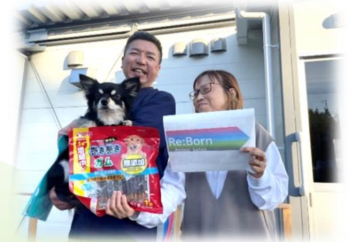
能登半島ペット共生被災者支援の様子

『 Re:Bornアニマルバトン 』活動とは、大切な思い出があるにもかかわらず、いずれ廃棄されてしまう、ペットロストアイテム(亡くなったペットによって遺されたフードやペット用品)やアンマッチペットアイテム(ペット不要品)を、飼い主様より託していただき、新たに『 レインボーアイテム 』として、保護団体等からペットを譲り受けたご家族や、能登半島等のペット共生被災者へ寄付をしたり、官民連携型のペット災害備蓄品として活かす事によって次の命にバトンする活動です。