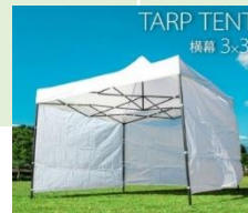
貸出しテント・テーブルの例